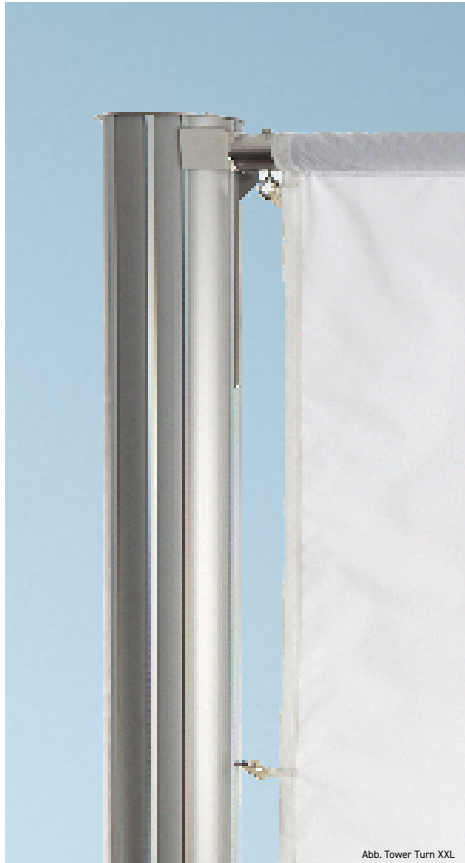
Abb. Tower Turn XXL