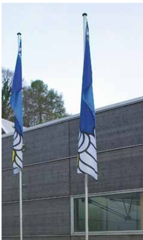
Fahnen OHNE HEROLD TOP-VISION-Flaggenstabilisator. Die Fahne hängt am Mast. Ihre Werbebotschaft geht verloren.