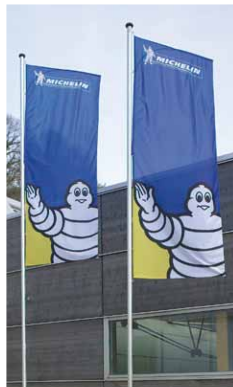
Fahnen MIT HEROLD TOP-VISION-Flaggenstabilisator. Ihre Botschaft kommt ohne Verluste bei Ihrer Zielgruppe an, und das bei jedem Wetter.